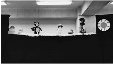
人形劇公演の様子