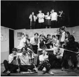
10月『アオハル・ネゴシエーション』