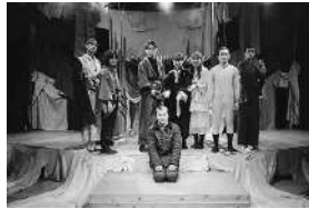
1月『劇場版 芝居小屋シアター THE STAGE』

1920年、創立。演劇研究会は早稲田大学随一の歴史と伝統を誇る公認サークルです。豊富な設備と大きさを持つアトリエで演劇をしています。会員はそれぞれの演劇活動に誠心誠意向き合っています。やりたいことをやりたいように表現できる空間です。