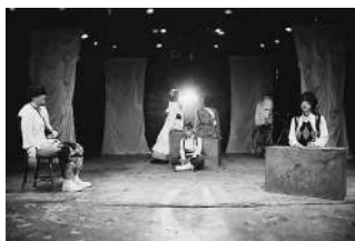
『めいめつ』 11月企画公演