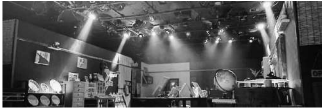
舞台美術研究会作品例(照明・美術)

入会金 なし 会費 半期 2000円 合宿 年1回 (状況によって変更 の可能性あり)