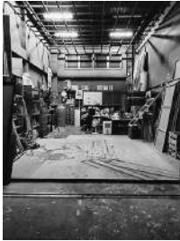
舞台美術研究会 アトリエ