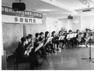
1/27 多摩稲門会出張演奏会