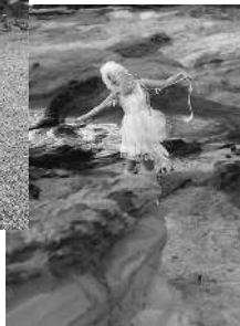
昨年度ルック写真