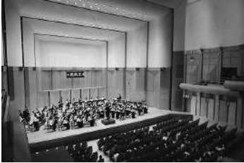
第211回定期演奏会 (2023年12月22日)

学生会館地下1階B117部室 活動場所:学生会館部室・練習室 活動日 毎週火・金・日曜日 入会金 5000円 会費 月1500円 合宿 年2回